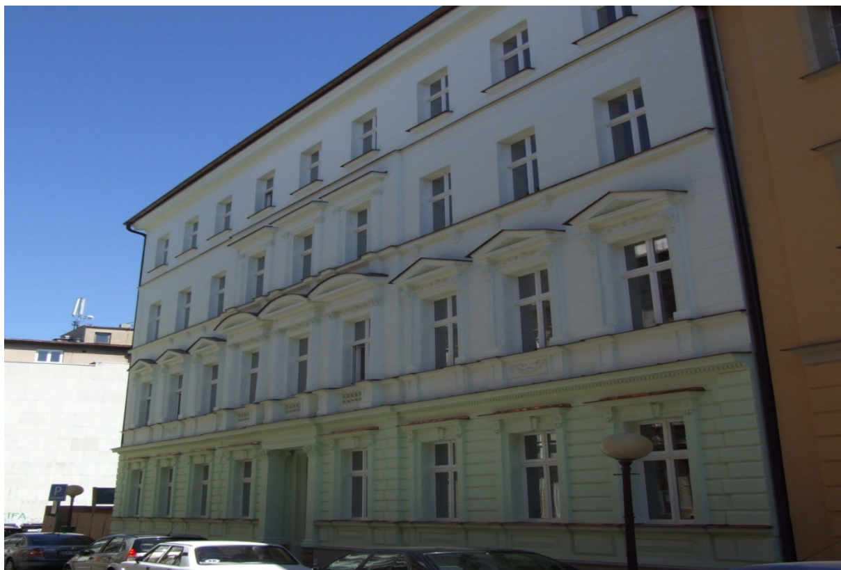
budova Konzervatória – Tolstého 11